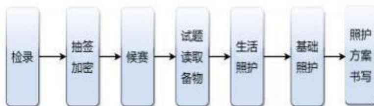
图2 参赛选手竞赛流程图

各参赛选手完成试题读取、备物后，持赛题案例、用物依次进入生活照护、基础照护两个赛室，最后进入照护方案书写室。